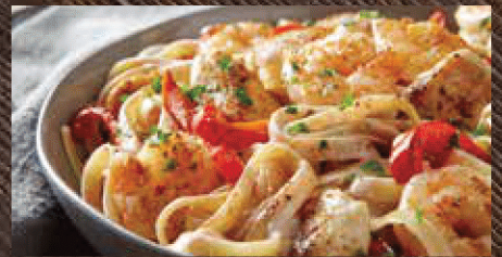
CAJUN SHRIMP & CHICKEN PASTA ケイジャンシュリンプ&チキンパスタ