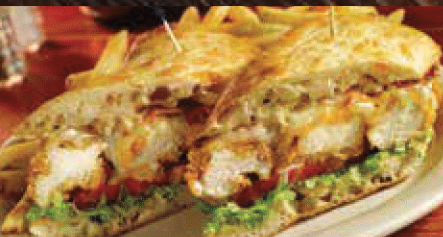
CHICKEN FINGER BLT SANDWICH チキンフィンガー-BLT サンドウィッチ