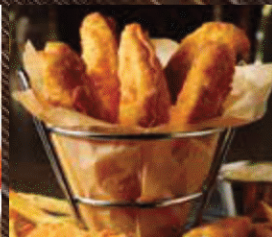
FISH & CHIPS フィッシュ&チップス