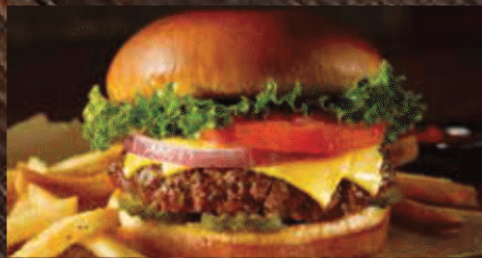
FRIDAYS TM CHEESE BURGER フライデーズ チーズバーガー