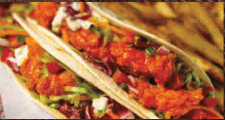
EXTREME BUFFALO CHICKEN TACOS エクストリーム パッファローチキン タコス