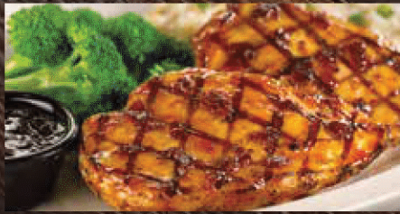
FRIDAYS TM SIGNATURE CHICKEN フライデーズシグネチャーチキン