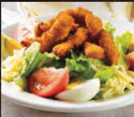
CAJUN FRIED CHICKEN SALAD ケイジャンフライドチキンサラダ (ハーフサイズ)