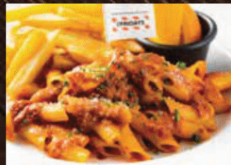
KIDS MEATSAUCE PASTA キッズミートソースパスタ