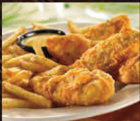
CHICKEN FINGERS チキンフィンガー (3ピース)

1 APPETIZER + 1 ENTRÉE + 1 KIDS MENU + DRINK (FREE REFILLS) = 3,190円 お好きな1皿 お好きな1皿 お好きな1皿 + 1 キッズドリンク (おかわり自由) (税込 3,509円)