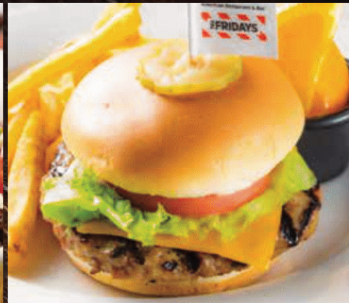
KIDS BURGER キッズバーガー