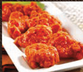
BONELESS BUFFALO CHICKEN BITES ボンレス パッファローチキンバイツ