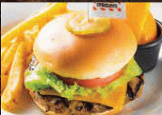
KIDS BURGER キッズバーガー