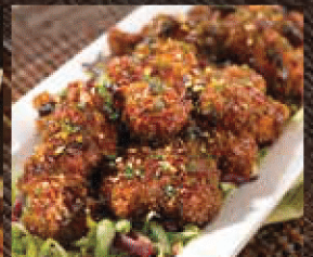
FRIDAYS TM SIGNATURE CHICKEN STRIPS フライデーズシグネチャーチキンストリップ