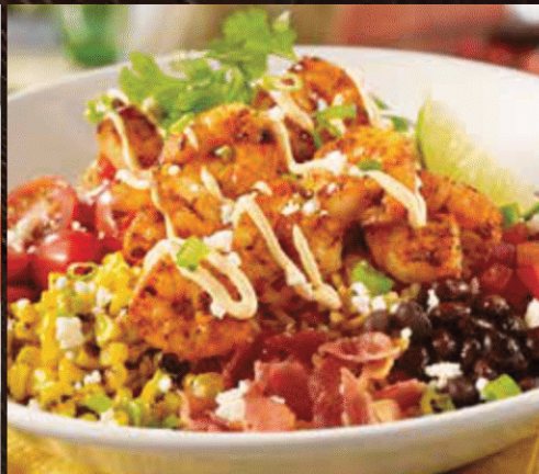
BLACKENEND SHRIMP MEXI BOWL ブラッケン シュリンプ メキシボウル