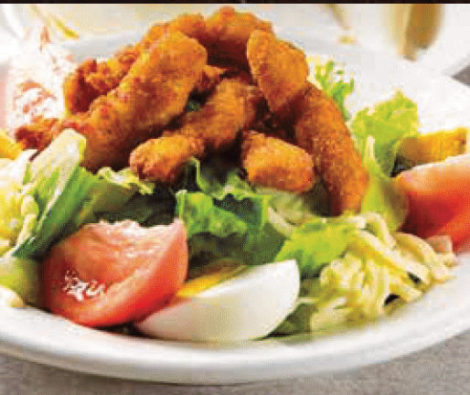
CAJUN FRIED CHICKEN SALAD ケイジャンフライドチキンサラダ(ハーフサイズ)