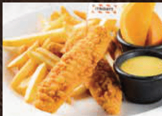
KIDS CHICKEN FINGERS キッズチキンフィンガー