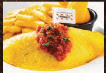
KIDS RICE OMELETTE キッズオムライス