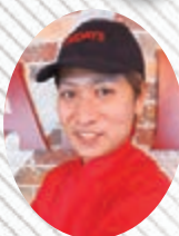
HIDEKI/ヒデキ 渋谷神南店

A juicy hamburger topped with three types of cheese cheddar, mozzarella and cottage. It makes you imagine winter snow.