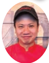
Shotaro/ショウタロウ 横浜西口店

トルティアチップスにブラックビーンズ、ミートソースをのせて更に2種類のチーズをのせて溶かしました。ピコデガヨ、ハラペーニョ、サワークリームをトッピングして提供します。ベーコン、チキン、ガカモレなどの追加トッピングも承ります。 Black beans and Meat sauce were placed on Tortilla chips, and two types of cheese were added. Served with Pico de gallo, Jalapeno and Sour cream toppings. Additional toppings such as Bacon, Chicken and Guacamole are also available.